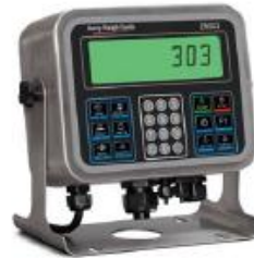
Edelstahlgehäuse TN-Anzeige IP69K