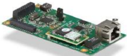
Interne WLAN-Karte 802.11b/g WLAN