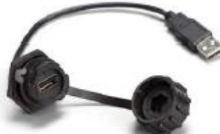
Wasserdichte Schnittstelle - USB-Anschluss