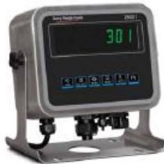
Edelstahlgehäuse IBN-Anzeige IP69K