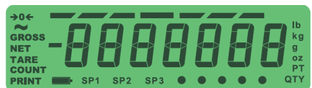
TN-Anzeige Ideal für die Verwendung in Außenbereichen (nur Waagen der Reihe ZM303)