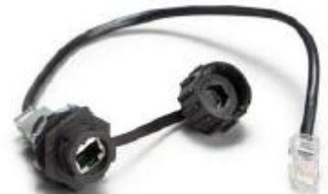
Wasserdichte Schnittstelle - Ethernetanschluss