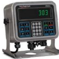
Edelstahlgehäuse IBN-Anzeige IP69K