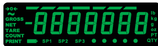
IBN-Anzeige Ideal für die Verwendung in Innenräumen

Damit die Bediener bei direkter Sonneneinstrahlung nicht so schnell ermüden, gibt es die Waagen der Reihe ZM303 auch mit TN LCD-Anzeige. Bei dieser augenfreundlichen Technologie werden dunkle Ziffern vor einem helleren Hintergrund und einer grünen Hintergrundbeleuchtung abgebildet, was die Waage für die Verwendung bei direkter Sonneneinstrahlung und an Abenden oder in Wintermonaten geeignet macht, wenn das Licht schwächer wird.