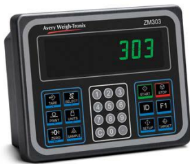
Aluminiumgehäuse zur Befestigung auf einer Tischplatte

Zusätzlich zu den schnellen, einfachen und funktionalen Modellen, die sich für den Einsatz in allen Umgebungen eignen, sind die Modelle aus gebürstetem Edelstahl (Sorte 304) auch noch mit einem Gelenkfuß ausgestattet, damit der geeignete Anzeigewinkel eingestellt werden kann. Sie verfügen des Weiteren über eine Vorrichtung zur Befestigung an einer Wand, einem Schreibtisch oder einer Säule.