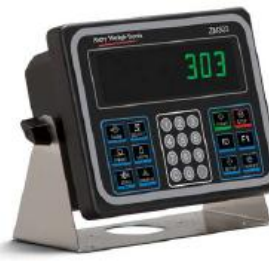
Standfuß-Satz Für Modelle mit Aluminiumgehäuse.