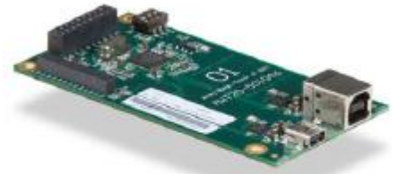
USB-Gerätekarte USB-Schnittstelle zum PC.