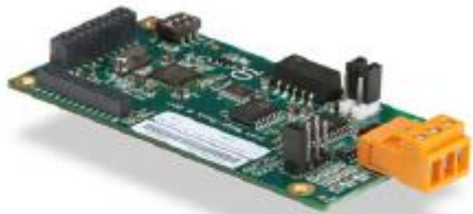
Analoge Ausgabekarte 0-10 Volt Gleichspannung und 4-20 mA.