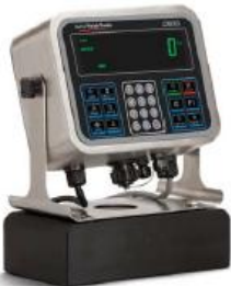
Externer Akkusatz Anschließbarer externer Akkusatz mit An-/Aus-Schalter. Mit vier D-Batterien für einen 12-Stunden-Betrieb bei Verwendung einer Wägezelle und einem 11-Stunden-Betrieb bei Verwendung von vier Wägezellen.